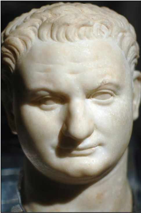
Portrait de Titus (Munich, Glyptothèque)