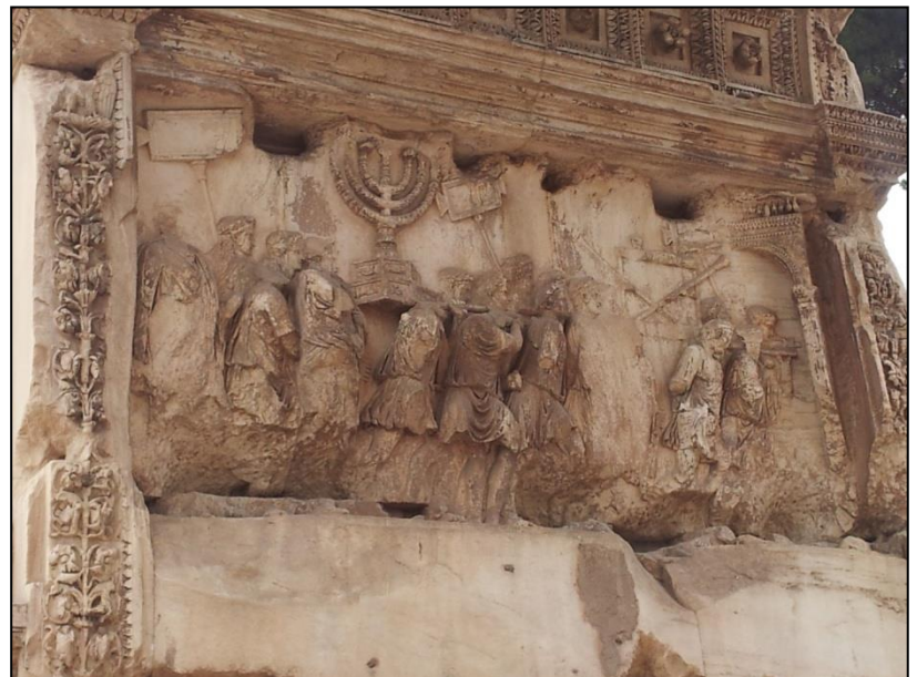
Arc de Titus, détail du bas-relief (pillage de Jérusalem, Rome, Forum)