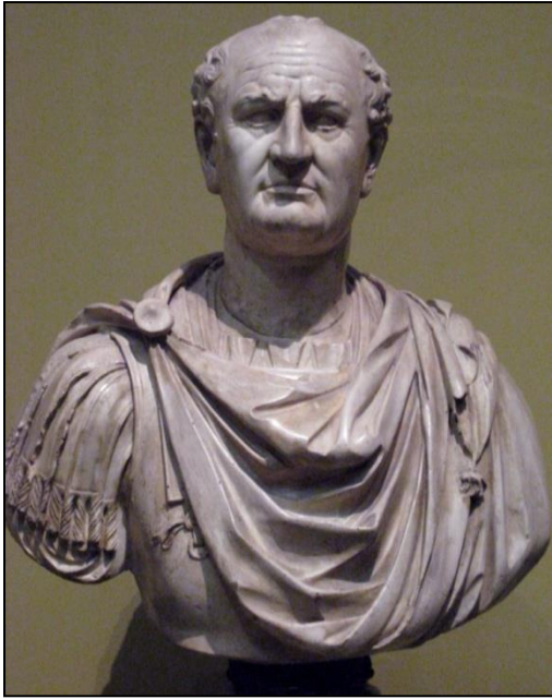
Portrait de Vespasien (Paris, musée du Louvres)