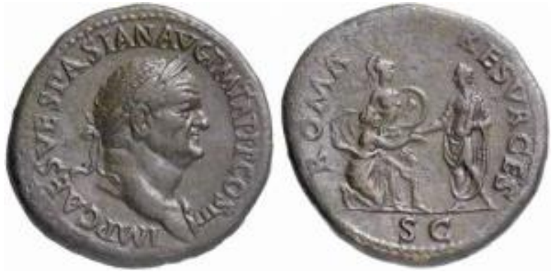
Sesterce de bronze de Vespasien (71) : Roma Resurges . (Avers : IMP CAES VESPASIAN AVG P M TR P P P COS III : Tête laurée de Vespasien à droite. Revers : ROMA RESVRGES / S C : Vespasien debout à gauche tendant la main pour relever Rome, agenouillée devant lui ; à l'arrière plan, Minerve, debout, casquée et tenant un bouclier).