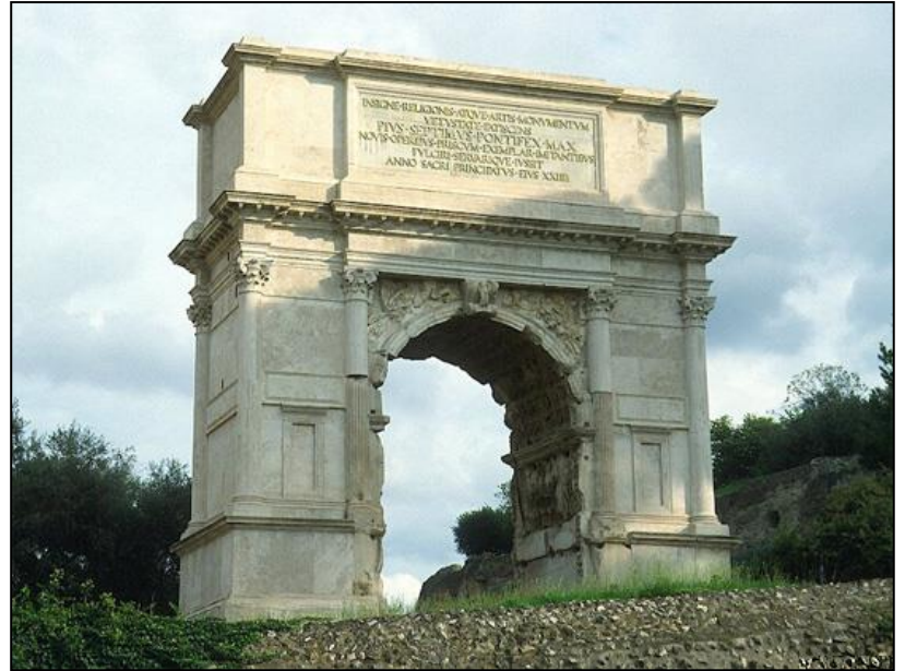
Arc de Titus (Rome, Forum).

Ce monument rappelle le rôle de Titus dans la guerre juive où il assumait le commandement des troupes romaines après le départ de Vespasien pour l'Italie. Cet arc fût construit sous Domitien.