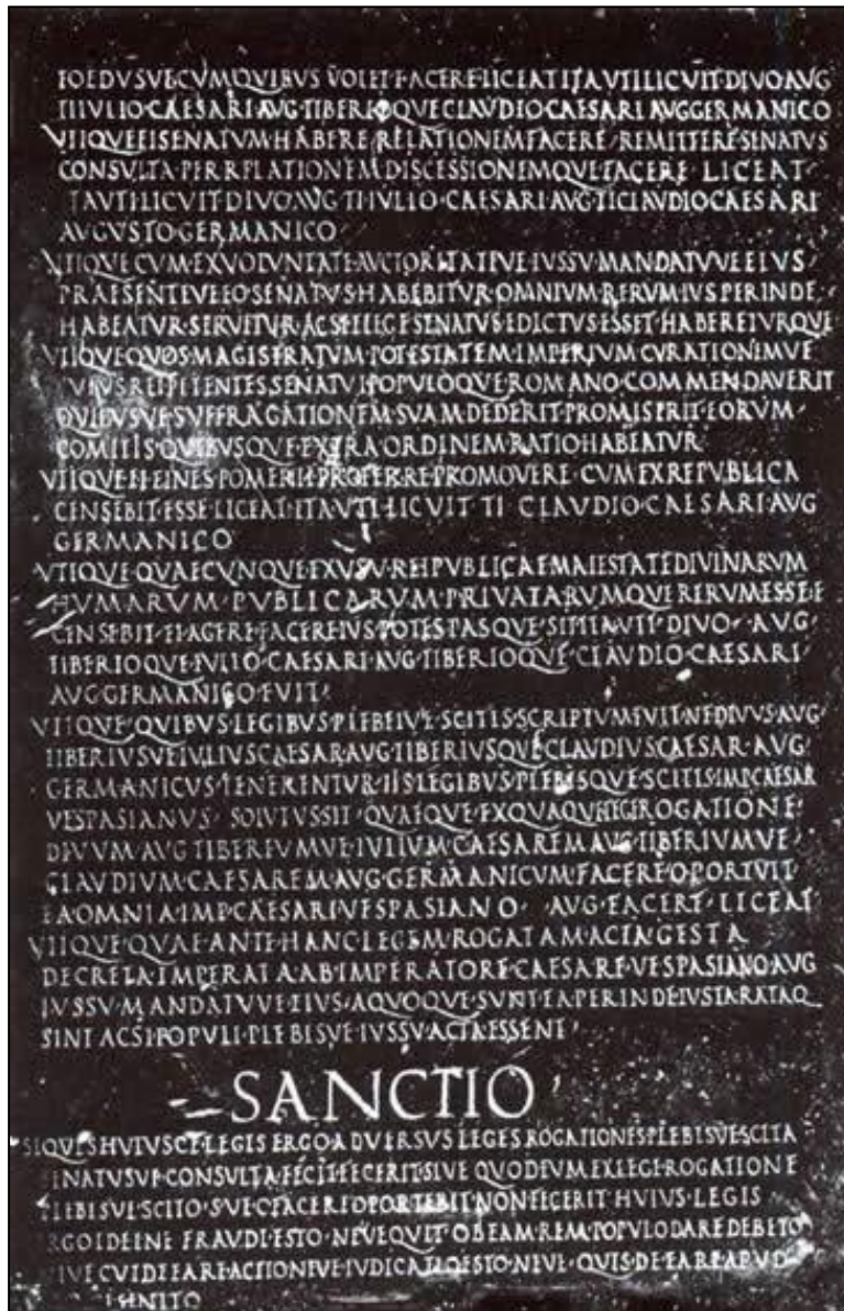
Lex de imperio Vespasiani (Rome, musée du Capitole)